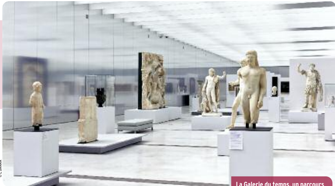
La Galerie du temps, un parcours inédit à travers l'histoire de l'art.

On n'est pas ici dans une annexe du Louvre, mais dans l'autre Louvre. Au Louvre de Paris, la muséographie est très structurée, on classe par départements, par écoles, par techniques, on insiste sur ce qui différencie. Ici, au contraire, on souligne ce qui rapproche. Dans un espace unique, on verra des œuvres produites par des civilisations différentes mais conçues à